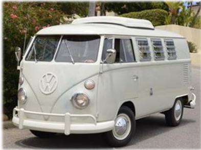
C'est la voiture préférée de Fanfan, le Combi de VW.