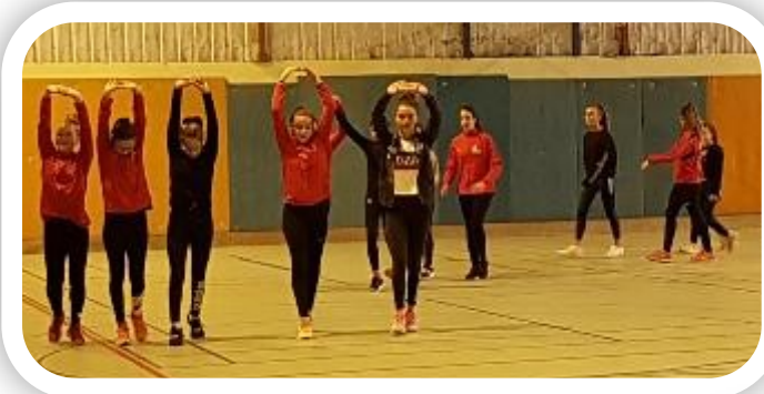
1 er entrainement Compétition challenge/solo