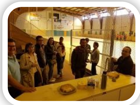
Accueil des parents autour d'un petit café