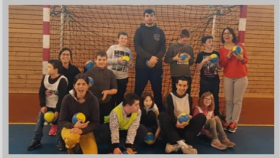
Le rendez-vous du Jeudi après-midi à Locmaria-Plouzané