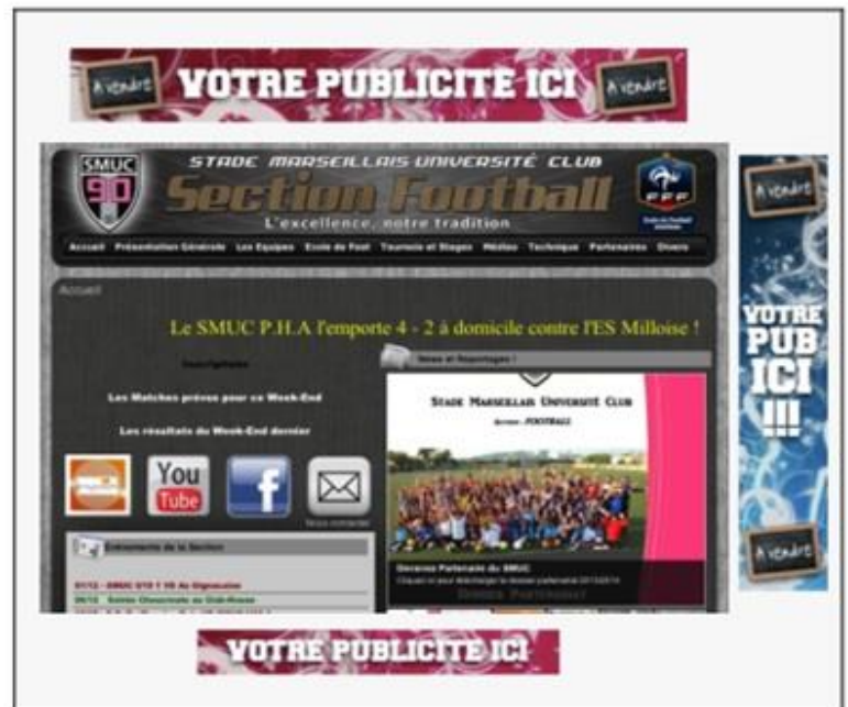
Exemple d'affichage des 3 zones de publicités sur le site de Stade Marseillais Université Club.

Pour informations et ceci afin de conforter votre prise de décision, la Section Football du SMUC c'est plus de 650 adhérents !