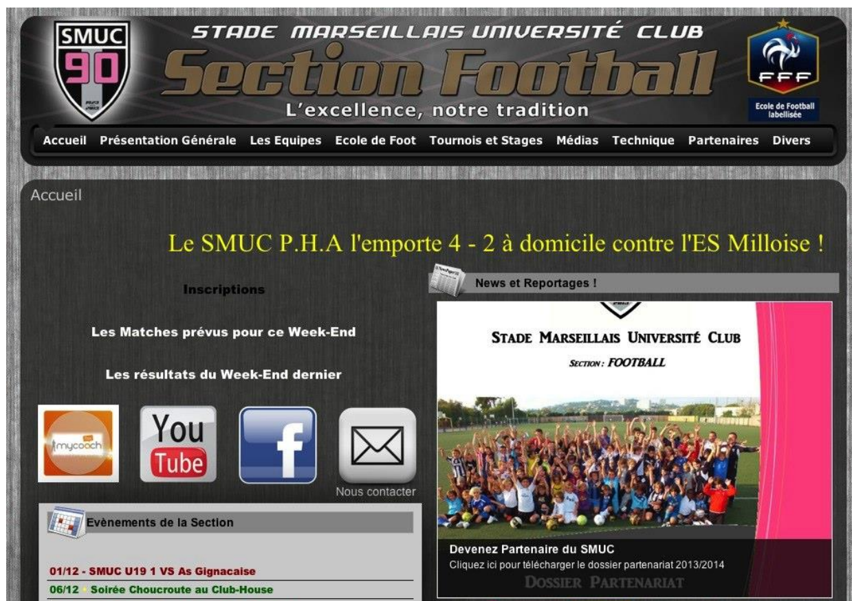
Page d'accueil de Stade Marseillais Université Club

Sponsoriser notre site web, c'est pour vous l'opportunité de diffuser à vos clients potentiels pendant la saison sportive les messages publicitaires de votre choix, sur des emplacements du site spécialement réservés à cet effet.