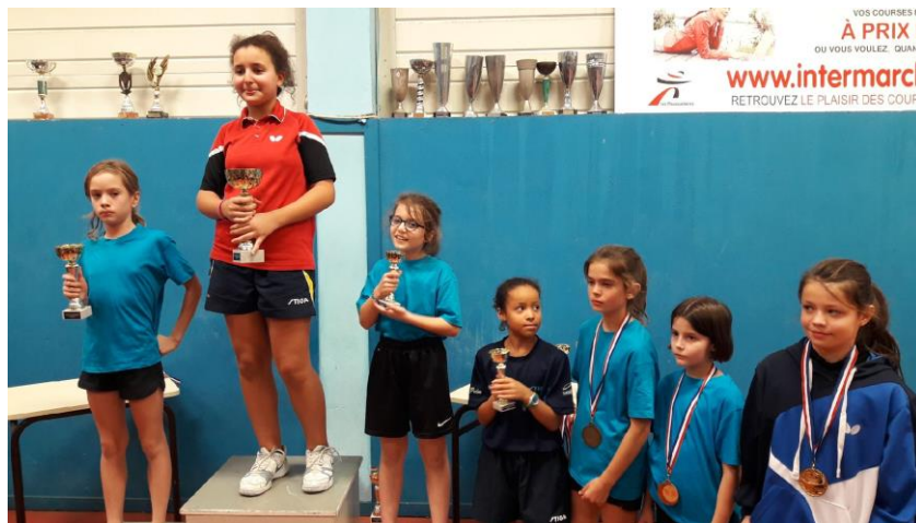
TABLEAU E (nées en 2009)