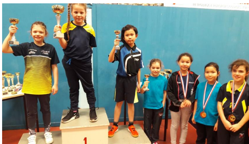
TABLEAU D (nées en 2010 et après)