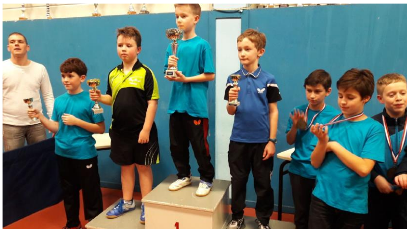
TABLEAU C (nés en 2008)