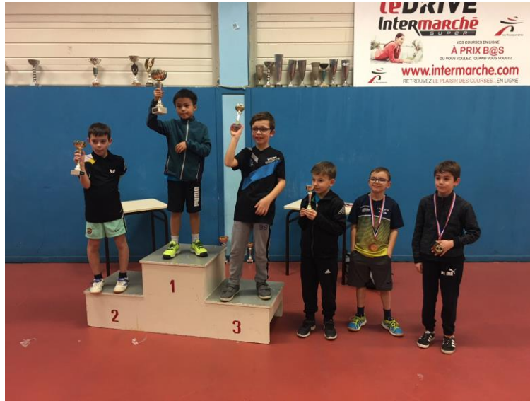
TABLEAU A (nés en 2010 et après)