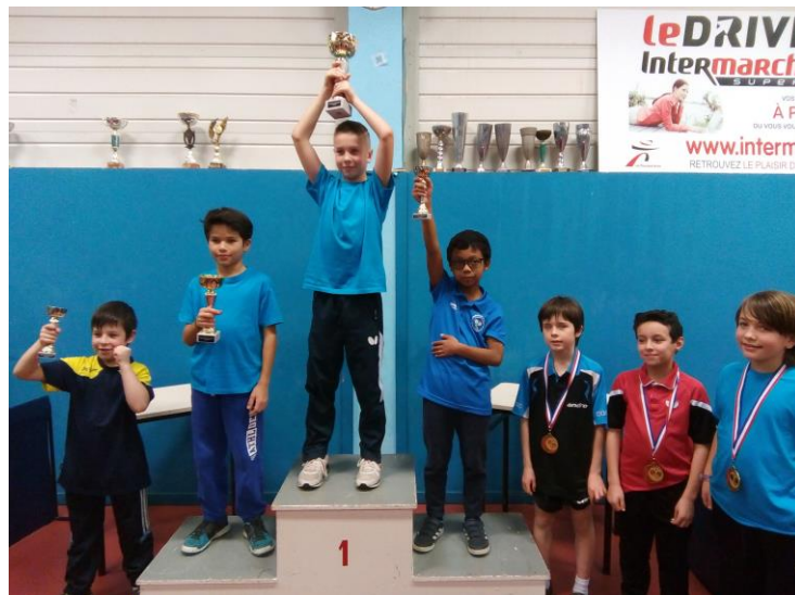
TABLEAU B (nés en 2009)