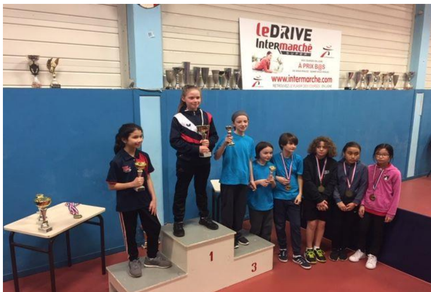
TABLEAU F (nées en 2008)