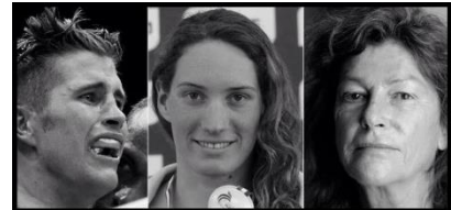
Alexis Vastine, Camille Muffat et Florence Arthaud

Pensée et minute de silence pour les 3 sportifs ainsi que pour les 7 autres personnes décédées lors du tournage télévisé en Argentine ce 9 mars 2015.