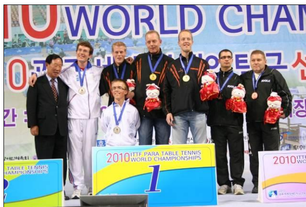
Podium du par équipe cl.9

Photos Championnats du monde, S. Messenger