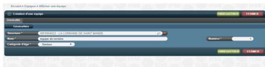
Figure 5 : création d'une équipe