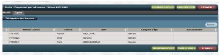
Figure 6 : déclaration des joueurs d'une équipe

Une fois l'équipe créée vous pourrez déclarer les joueurs et entraîneurs de cette équipe, en passant sur l'onglet 'Equipe'