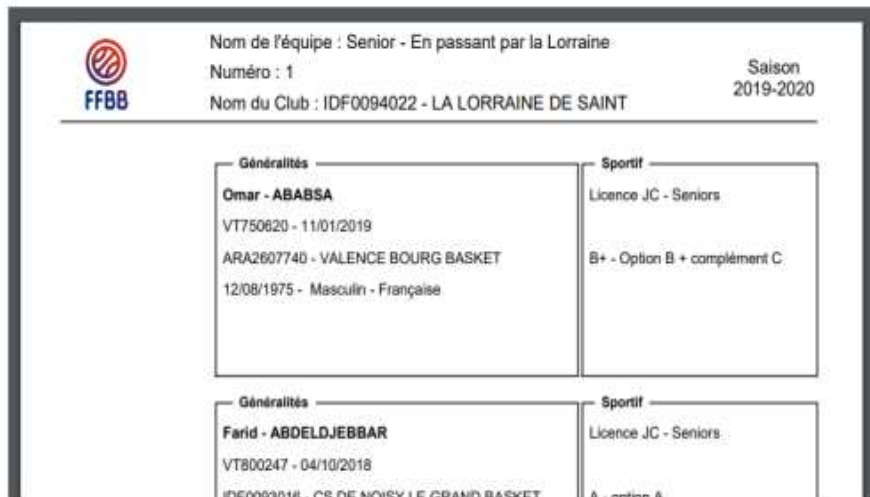
Figure 7 : trombinoscope de votre équipe au format PDF

Suivre le lien suivant pour voir la vidéo de la procédure :