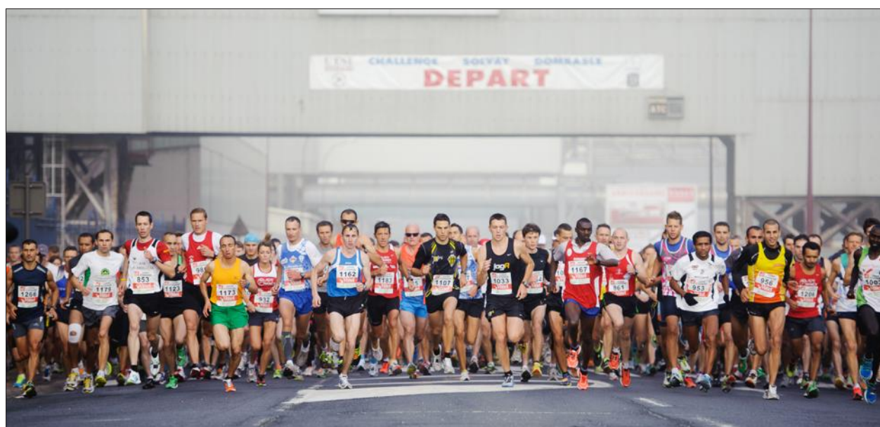
■ La brume est à peine levée que les coureurs ont déjà pris leur envolée.