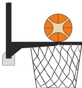
Figure 2 : Ballon en contact avec l'anneau

Il y a intervention illégale par un joueur défenseur ou attaquant si, lors d'un tir au panier, un joueur touche le panier ou le panneau alors que le ballon est en contact avec l'anneau et qu'il a encore la possibilité de rentrer dans le panier.