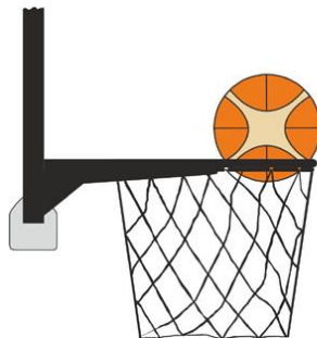
Figure 3 : Ballon dans le panier

Il y a violation pour intervention illégale si un joueur défenseur touche le ballon quand il est dans le panier.