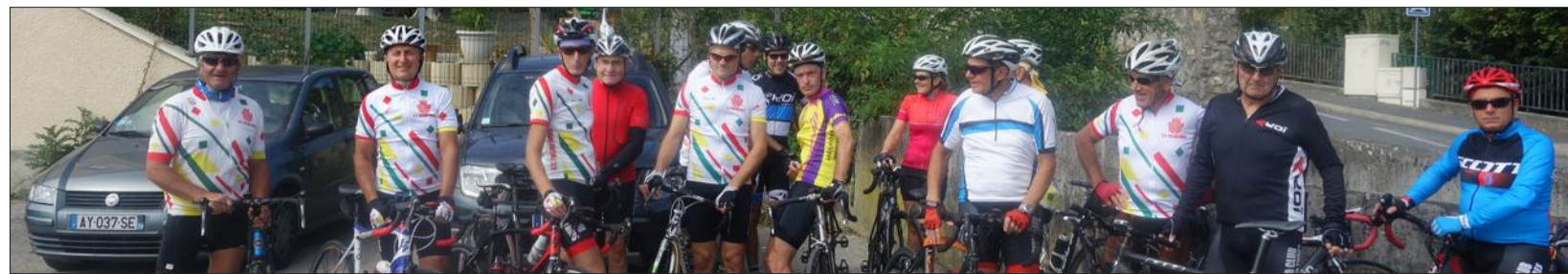
Les cyclos tullinois au départ de la reconnaissance des circuits.

Ce samedi, si la météo est favorable, le cyclo club de Tullins, organisateur de la randonnée de la Noix, attend près de 700 participants venus de tout le département. Cette randonnée est la dernière de la saison inscrite au calendrier départemental. Elle