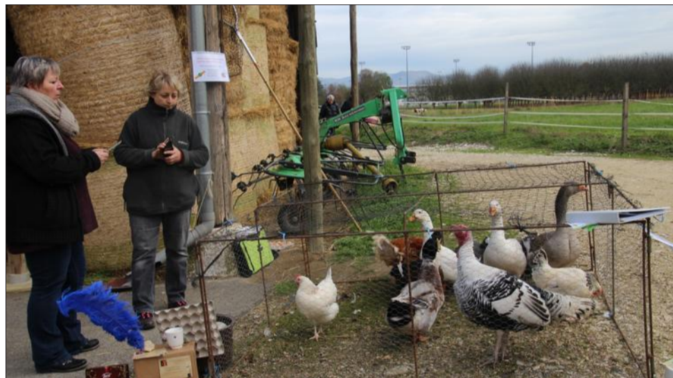
Tous les produits du terroir sont présents à chaque marché paysan.

Ce dimanche 14 octobre, les producteurs seront présents de 9 à 12 heures.