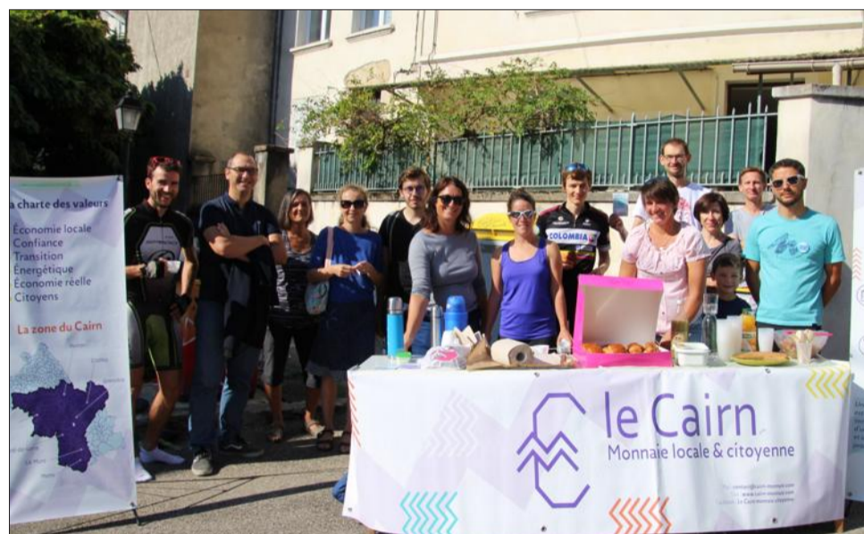
Beaucoup de monde était présent hier pour cette première de l'opération Cyclo Tour du Cairn.

Une Monnaie locale et citoyenne (MLC) est un titre de paiement qui circule sur un territoire délimité et au sein d'un réseau d'acteurs choisis (commerces et services de proximité, artisans, producteurs, associations et PME locales), sans possibilité d'épargne ni de spéculation. Une MLC facilite le développement des circuits courts, dynamise l'économie locale et soutient une économie solidaire et respectueuse de l'environnement. Ces monnaies sont dites complémentaires car elles ne cherchent pas à remplacer la monnaie nationale mais circulent sur le territoire.