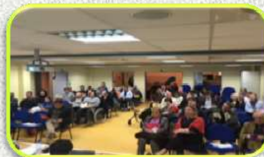
Assemblée Générale CDH 31 - 20 janvier 2017

Le premier Comité Directeur du CDH 31 a eu lieu le jeudi 23 février 2017 à la Maison des Sports de Labège.