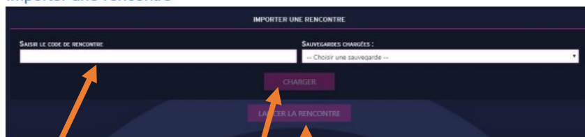
Figure 1 Importer une rencontre

Chaque rencontre est identifiée par un code rencontre unique. La génération du code se fait suite à la création d'une rencontre dans FBI et sera envoyée à l'utilisateur sur le mail associé à son compte.