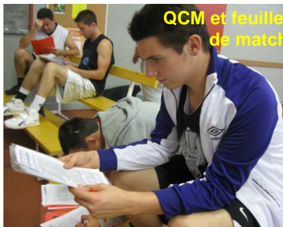
QCM et feuille de match

■ Tous les officiels présents au stage ont reçu la synthèse des évaluations et la commission les encourage à travailler en conséquence. Le stage de janvier prochain permettra à la commission de mesurer le travail effectué par chacun.