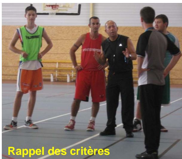
Rappel des critères