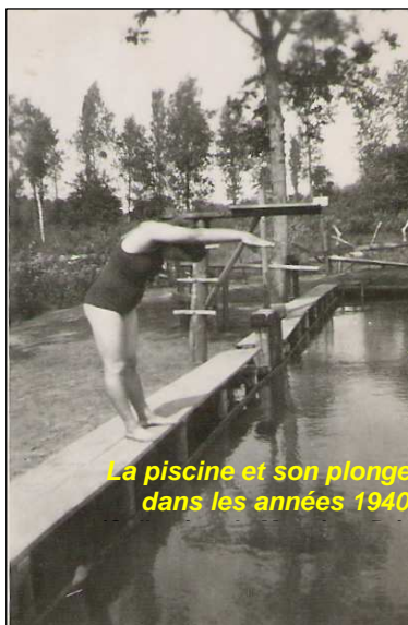
La piscine et son plongeur dans les années 1940

L'année suivante, les membres se retrouvent au café Rouillard à 21 heures. Ils décident que le bassin de natation provisoire serait au lieu du Verger ; d'ailleurs l'un des membres de l'Association est Monsieur Briolay, cultivateur au Verger. De plus, ils souhaitent la création de cabines en genêts provisoires. L'association a malgré tout un projet de construction d'une véritable piscine. Dans la réunion suivante, au café Denis, on apprend que l'ouverture se fera le 9 juin 1942. Des cartes familiales, individuelles, scolaires et de membres honoraires sont instaurées ; des horaires sont fixés : de 17h30 à 21 heures en semaine et dès 16 heures le dimanche