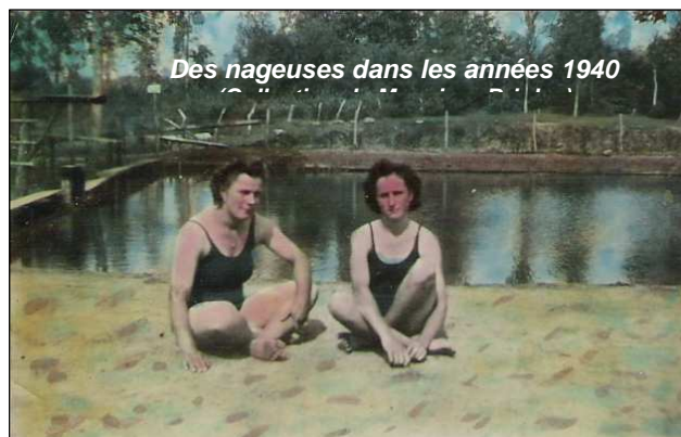
Des nageuses dans les années 1940

Le 29 juillet 1942, au café Audebourg, les membres font un bilan. Une fête, le 9 août 1942, est proposée dont le bénéfice sera versé à la caisse des prisonniers de guerre de la commune. La somme sera employée à la confection de colis gratuits pour tous les prisonniers. Les nageurs de l'association des Pingouins de l'Huisne et les musiciens de Saint Mars d'Outillé sont sollicités. L'entrée est gratuite pour les enfants et les femmes de prisonniers. Cette fête aura lieu également le 25 juillet 1942, puis le 15 août 1943.