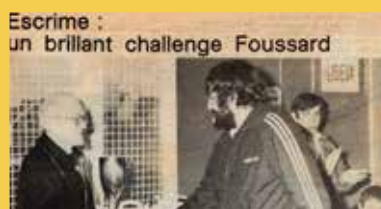
Escrime : un brillant challenge Foussard