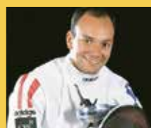
Hugues OBRY Champion Olympique par équipe 2004 et double champion du Monde individuel & équipe

1993 Cyril FAUCHER St Gratien 1994 Rémi GERVAIS ASPTT Paris 1995 Hugues OBRY St Gratien