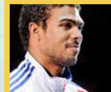
Yannick BOREL Champion Olympique par équipe 2016 et quadruple champion du Monde individuel & équipe