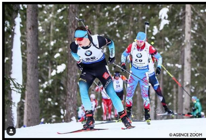
Emilien lors de la poursuite

A noter qu'à l'issue de cette dernière étape européenne, Martin Fourcade a déclaré faire l'impasse des prochaines étapes de la tournée nord-américaine et rentrer chez lui à Villard pour se reposer ... une participation à l'étape de Corrençon du Samse National Tour que nous organisons les 09 et 10 février prochain ?... A suivre !