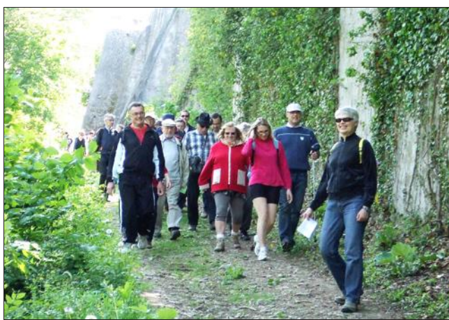
■ Un instructif après-midi de découverte patrimoniale.