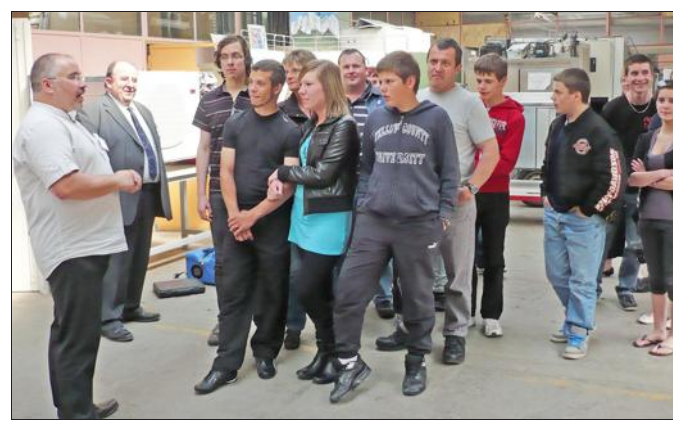
■ Une visite orientée sur la découverte des ateliers.

Les 3 e portes ouvertes de l'ensemble scolaire mixte privé de Bosserville ont eu lieu samedi. Plusieurs centaines de visiteurs ont déambulé dans les allées. « Le recrutement dans un lycée comme Bosserville se fait en plusieurs étapes en fonction des niveaux de scolarisation. L'opération portes ouvertes de février est principalement ciblée sur les BTS étant donné que les inscriptions dans le régime post-Bac se font début mars alors que celles de mars, plus traditionnelles, s'adressent aux collègues et lycées technologiques et professionnels.