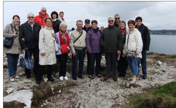
■ Bien couverts, les sorties étaient très agréables.

L'Association des retraités et personnes âgées a organisé un séjour en Bretagne. Cinquante-trois personnes sont parties pour la Presqu'île de Crozon où ils étaient hébergés dans un hôtel charmant au bord du port. Une semaine riche en