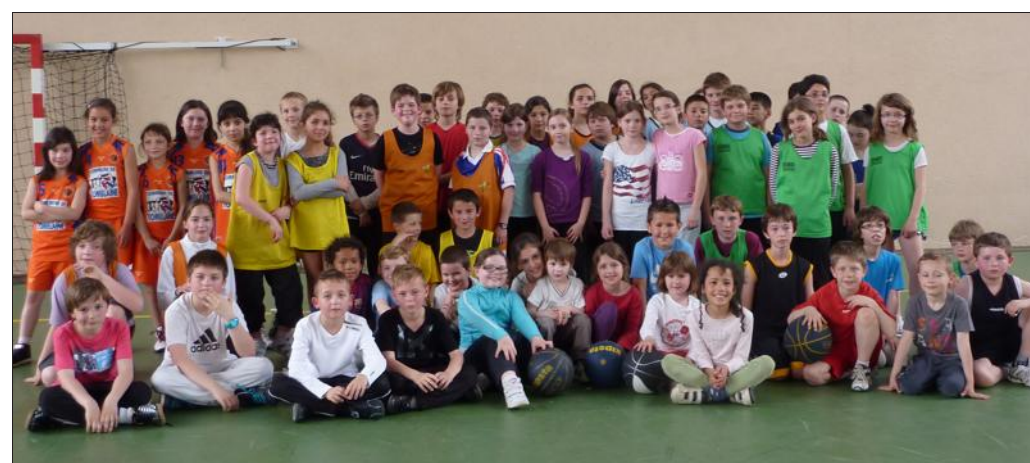
■ Des jeunes de différentes communes réunis pour deux heures de basket non-stop.

Le tournoi départemental USEP a réuni, à la salle des sports du Mancès, quatre-vingts enfants de CM1-CM2 des écoles Pierre-Loti de Ludres, Pampidou de Pont-à-Mousson, Gallé de Maizières, Katia-Krafft d'Houdemont, Brossolette de Tomblaine, Victor-Hugo d'Heillecourt et Chardin de Maizières. Sur trois terrains matérialisés dans la longueur, les enfants ont évolué, en collaboration avec le Comité départemental de basket et,