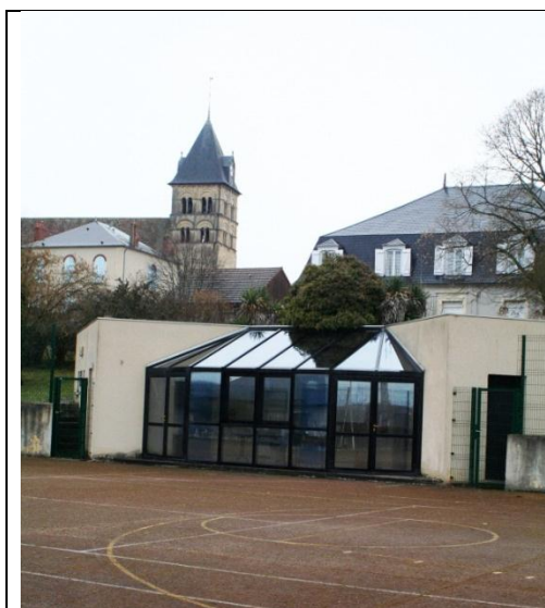
Terrain extérieur, rénové en 1992

Un premier pas est fait dans l'approche de la professionnalisation avec la création, en 1996, d'un « contrat emploi Association » en partenariat avec une autre association Marzyate l'ACSL (Association Culture Sport et Loisirs).