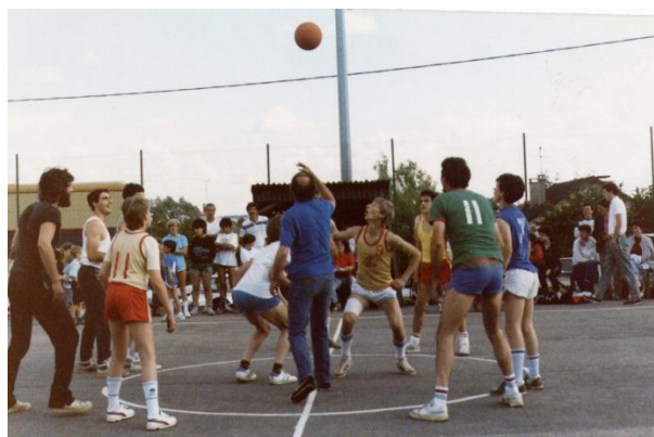
Tournoi de fin de saison avec en arrière-plan, la cabane.