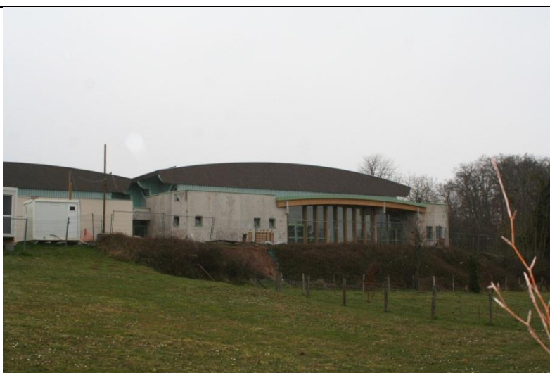
L'ensemble polyvalent en 2011 avec, à droite, l'extension en travaux. A gauche ce qui correspondait à la « salle polyvalente ».