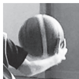
U13F1 - Houdemont - 27/04/2019

https://public.joomeo.com/albums/s_5cc846712bd69/slideshow