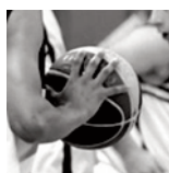
SM1 - Saint-Max - 02/03/2019

https://public.joomeo.com/albums/s_5cc83c53e54a3/slideshow