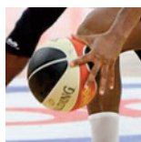
ProB - Nantes - 27/04/2019

https://public.joomeo.com/albums/s_5cc6a655d8853/slideshow