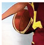
U13F1 - Lunéville - 30/03/2019

https://public.joomeo.com/albums/s_5ca1bacc7f9e0/slideshow