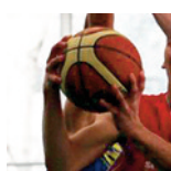
U17M2 - Metz - 16/12/2018 https://public.joomeo.com/albums/s_5c17aeba2f8b9/slideshow