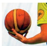
Vandœuvre - PNF - 09/12/2018 https://public.joomeo.com/albums/s_5c17993f71629/slideshow

Pour alimenter la photothèque, déposez vos photos sur sluc.photos@gmail.com