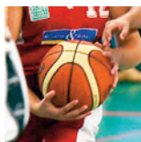
U15F2 - BC Thermal - 10/11/18 https://s.joomeo.com/5bfbb43393c2f

Pour alimenter la photothèque, déposez vos photos sur sluc.photos@gmail.com