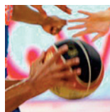
Sluc ProB - Rouen - 19/11/18 https://s.joomeo.com/5bf41e9202c99