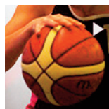
SF1 - GET Vosges - 25/11/18 https://s.joomeo.com/5bfbacf749326