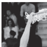
Sluc ProB - Aix Maurienne - 16/11/18 https://s.joomeo.com/5bf276f14560e