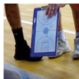
Épinal - U15M2 - 25/11/18 https://s.joomeo.com/5bfbb28bd06e9