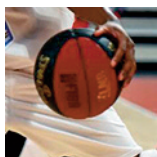
NM3 - Mirecourt - 10/11/18 https://s.joomeo.com/5bebdd1e1d49e