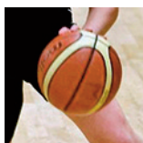
U15M1 - Reims - 18/11/18 https://s.joomeo.com/5bf52bc32643f