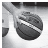
U17M2 - COS Villers - 25/11/18 https://s.joomeo.com/5bfbabf7ec57b