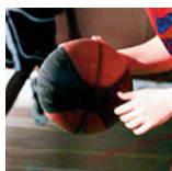
HDL - U17M2 - 18/11/18 https://s.joomeo.com/5bf513603e9b6