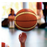
U13F2 - Frouard - 10/11/18 https://s.joomeo.com/5bf2c95090c65