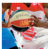
Sluc ProB - Quimper - 13/10/2018

Pour alimenter la photothèque, déposez vos photos sur sluc.photos@gmail.com