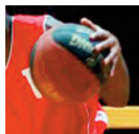
U15M2 - Cormontreuil - 24/03/2018 https://s.joomeo.com/5ab9dfbcc5807

Pour alimenter la photothèque, déposez vos photos sur sluc.photos@gmail.com