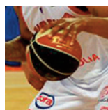
ProB - Quimper - 27/03/2018 https://s.joomeo.com/5abb315232de1