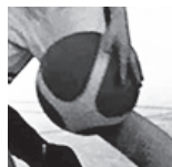
U11F1 - Dieuze - 24/03/2018 https://s.joomeo.com/5ab9e0cfe0728