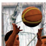
SM3 - Porte Verte - 11/03/18 https://s.joomeo.com/5aafe8084498f

Pour alimenter la photothèque, déposez vos photos sur sluc.photos@gmail.com