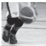
Baccarat - U15M4 - 11/03/18 https://s.joomeo.com/5aaf732c8ad57