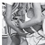
COS Villers - U11F1 - 16/03/18 https://s.joomeo.com/5aaf6eb669a9d