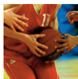
U15M2 - Metz BC - 14/03/18 https://s.joomeo.com/5ab0d992b7e55