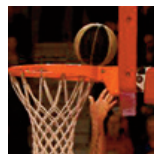
Sluc ProB - Orléans - 09/12/17 https://s.joomeo.com/5a2e83bea4048