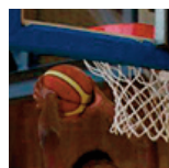
Reims - U17M2 - 10/12/17 https://s.joomeo.com/5a2f7df6cce62