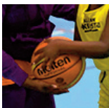
Tournoi Parents-Enfants - 08/12/17 https://s.joomeo.com/5a2e579331668

Pour alimenter la photothèque, déposez vos photos sur sluc.photos@gmail.com