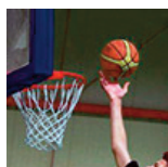
3 Pays-Mulhouse - U17M2 - 12/11/17 https://s.joomeo.com/5a0dc13e58e76

Pour alimenter la photothèque, déposez vos photos sur sluc.photos@gmail.com