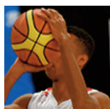
SM2 : échauffement - 17/11/17 https://s.joomeo.com/5a105d4e90c11