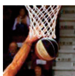
Sluc ProB - Rouen - 18/11/17 https://s.joomeo.com/5a1333fa9e449