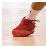
Espoirs - Coulommiers - 14/10/17 https://s.joomeo.com/59e4ba2e92026