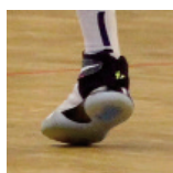
U15M1 - Reims - 15/10/17 https://s.joomeo.com/59e60dab63dfe