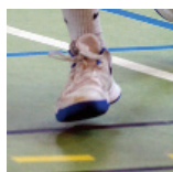
Eckbolsheim - U17M2 - 08/10/17 https://s.joomeo.com/59df19a1924e8

Pour alimenter la photothèque, déposez vos photos sur sluc.photos@gmail.com