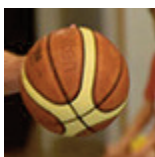
SM1 - HDL - 08/10/17 https://s.joomeo.com/59ddfc45c5b98