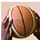
ASPTT Metz - U15M2 - 08/10/17 https://s.joomeo.com/59dc64f9329b6

Déposez les vôtres sur sluc.photos@gmail.com afin qu'elles soient visibles par tous les joueurs de votre équipe !