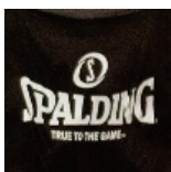
U13M3 - Bayon - 05/10/17 https://s.joomeo.com/59dc7512b4372