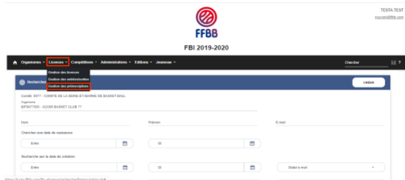
Figure 2 : Nouvel écran « Gestion des préinscriptions »