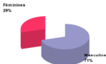
Répartition des licenciés au 19/03/2014