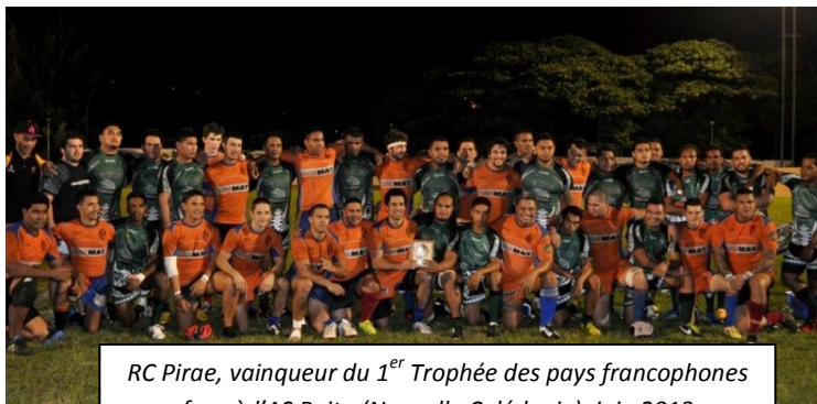
RC Pirae, vainqueur du 1 er Trophée des pays francophones face à l'AS Paita (Nouvelle Calédonie), juin 2013

Créé en avril 2002, le Rugby Club de Pirae est depuis quelques années la référence dans le milieu du rugby Polynésien. Sur les 5 dernières années il est le club le plus titré de Polynésie.