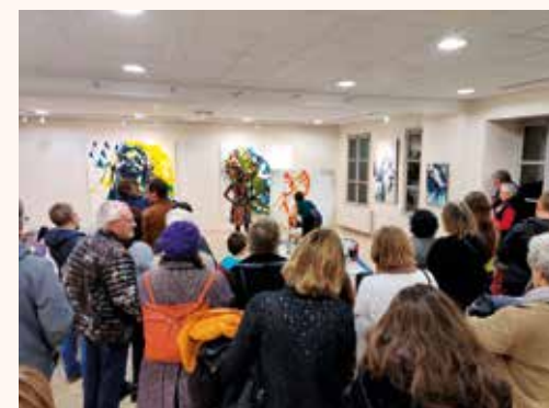
Vernissage de l'exposition "MERCII"