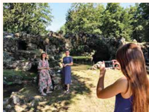
Tournage de la vidéo sur le Pont de Roches

Vous pouvez réserver sur place auprès de l'équipe du Centre Culturel, par téléphone au 01 64 95 43 31 ou bien envoyer un mail à centreculturel.mereville@caese.fr .