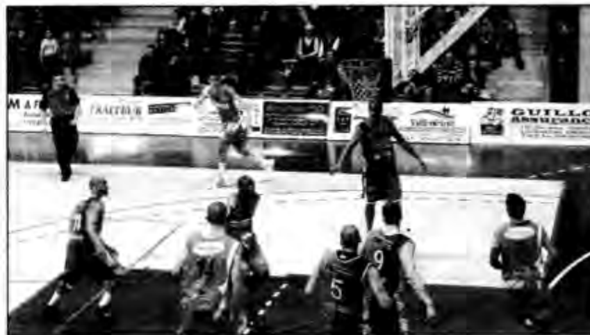
Les EFF jouent au Forezium contre Ouest Lyonnais samedi 3 mars à 20h.

Cependant, c'est, dès samedi, retour au quotidien, avec le championnat. Et le quotidien est beaucoup plus morose que cette véritable bouffée d'oxygène que constitue la coupe de France. Les Foréziens sont, depuis le revers lors de la journée de championnat précédente contre le reléguable Aix-Maurienne, à nouveau avant-derniers de la poule A de NM2.