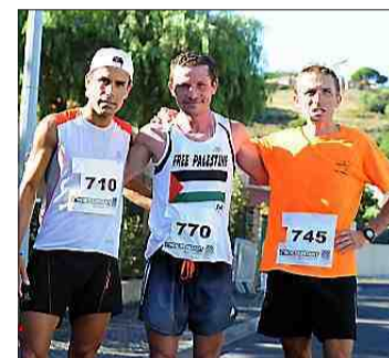
Les podiums du « court » messieurs et les deux « longs » messieurs et dames.