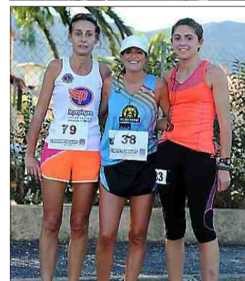
Podium du « court » dames.