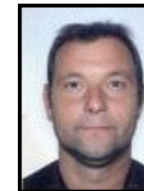
Week-end Pascal JUILLET 06 71 70 90 23