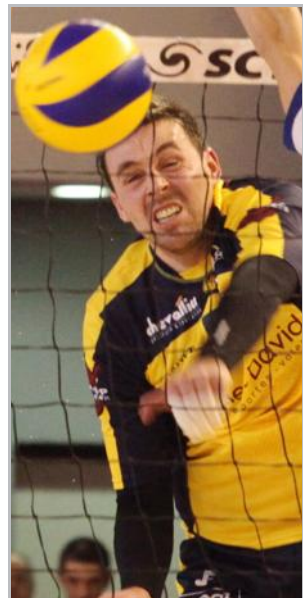
Le SAS Volley reçoit Saint-Maur, samedi soir.

Nationale 2 masculine 20 h : Epinal - Saint-Maur