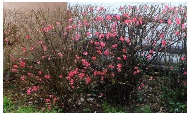
■ Très en avance sur le printemps...

Malgré l'altitude, la commune étant à 630 m, les fleurs du parking de la place du 19-Mars sont déjà épanouies.