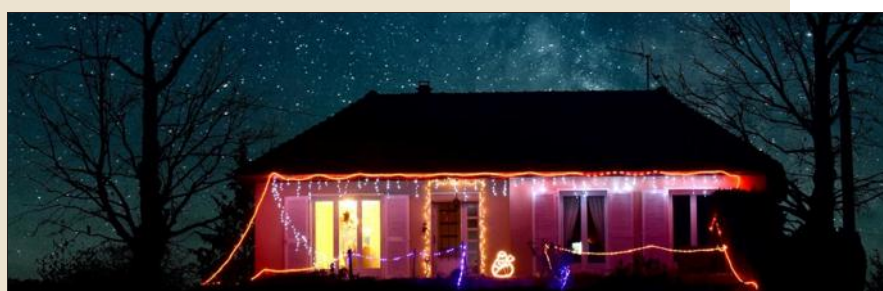
■ Une maison sous les étoiles.

Chaque année, les Panissiétois rivalisent d'imagination pour illuminer leur maison. Dans la campagne, l'une d'entre elles a retenu notre attention avec, ce soir-là, une pluie d'étoiles.