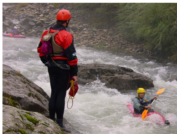
"Illustration 1" Placement sécuritaire de la berge