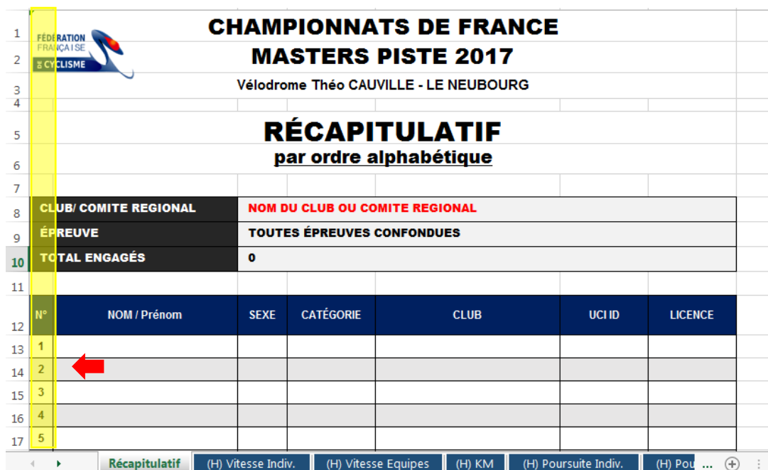
Figure 1 - Identifiant unique du coureur dans le tableau "Récapitulatif"

Une fois cette étape terminée, et pour faciliter la saisie des informations suivantes, nous vous conseillons d'imprimer cette feuille récapitulative . Seuls les numéros (identifiants) vous seront demandés par la suite.