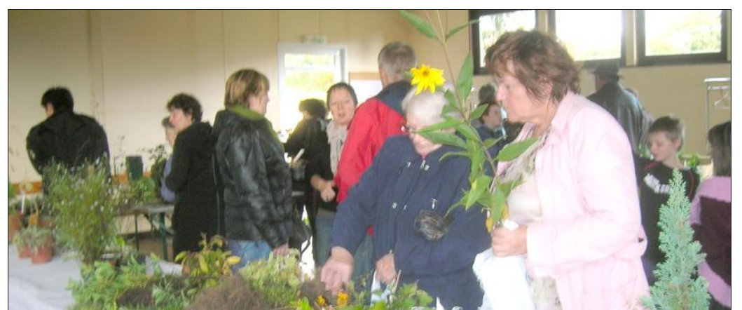
■ Le public est venu en nombre.

Cette bourse a donc tenu toutes ses promesses, malgré un temps maussade, beaucoup de plantes ont été échangées par des connaisseurs avertis.