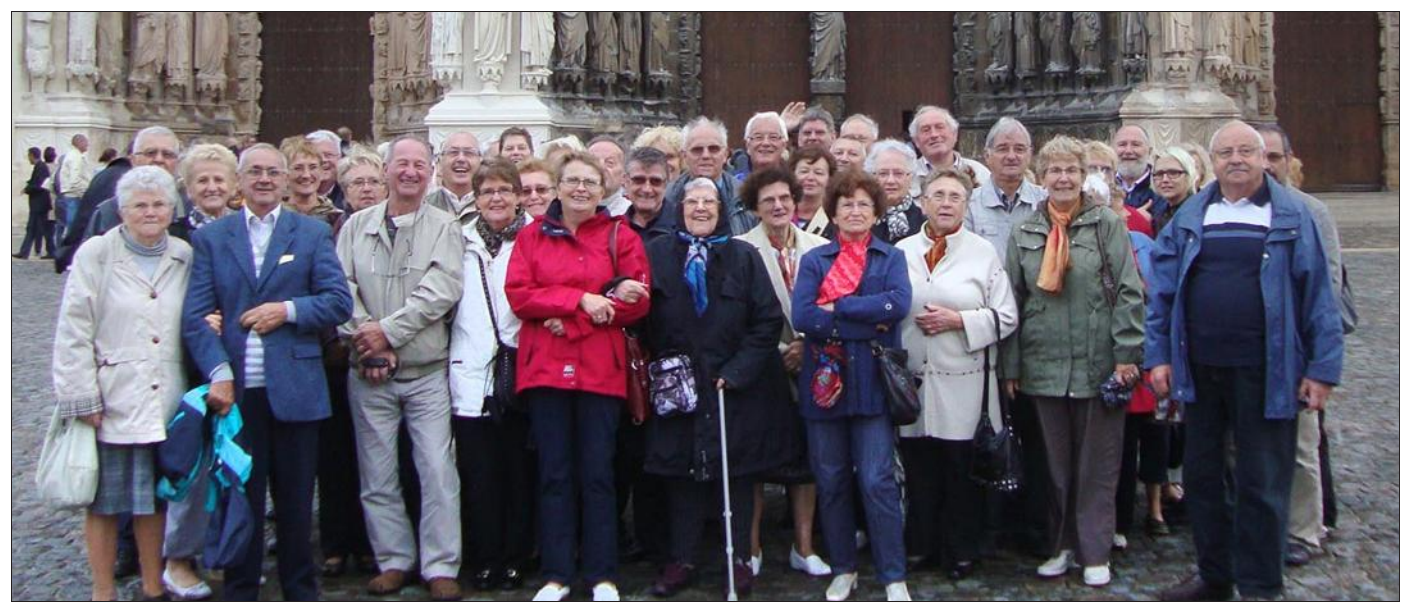
■ Dans une très bonne ambiance.

Une soixante de personnes, membres du club de l'amitié, se sont rendues en Champagne pour une découverte de la ville de Reims, ainsi que la visite d'une grande maison de champagne. Parti le matin en autobus, le groupe a fait une première étape pour visiter la magnifique cathédrale de Reims. Dédiée à la vierge Marie, ce superbe édifice dont les travaux ont débuté en 1211 est l'une des réalisations majeures de l'art gothique. Achevée en 1275, la cathédrale qui compte 2.303 statues mesure 138 m de haut et la hauteur de la nef sous voûte est de 38 m. Elle a accueilli le baptême de Clovis et fut le lieu de sacre des rois de France. Le groupe a ensuite rejoint un restaurant du centre ville pour un excellent déjeuner suivi d'une