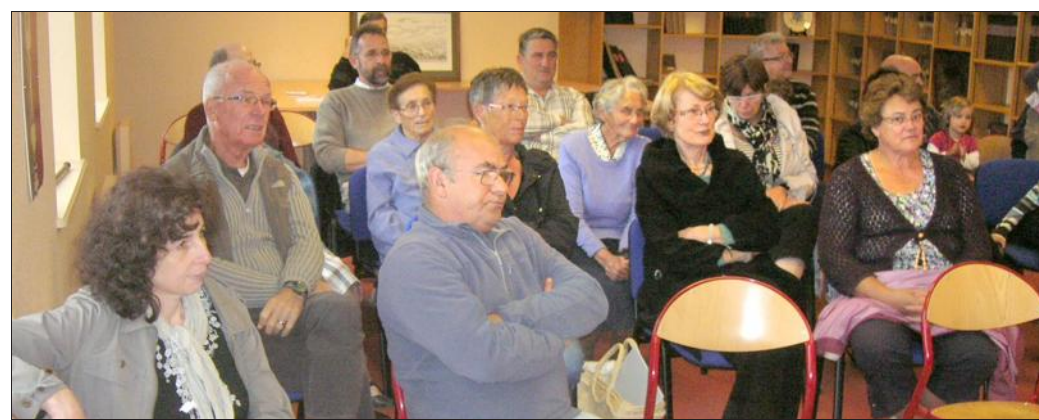
■ Un public attentif.

Chaque événement de la saison passée a été évoqué et commenté par les différents responsables : gymnastique, tennis de table, belote... Les nouveautés de la sai-