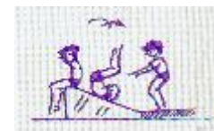
TOURNER EN ARRIERE